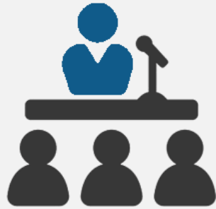
تعداد کل: ۸۷ سمینار و آرایه‌ها