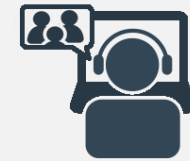
Online / Offline