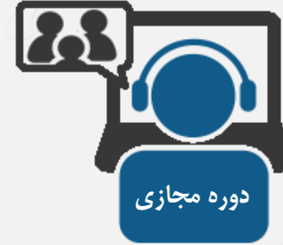
تعداد کل: ۱۴ دوره مجازی

* آمار فوق‌الذکر بیانگر عملکرد قطعی تا تاریخ ۹۷/۱۱/۱۵ و فعالیت‌های در حال اجرا تا پایان سال می‌باشد. (نفر ساعت سمینارها و آرایه‌های آتی محاسبه نشده‌اند)