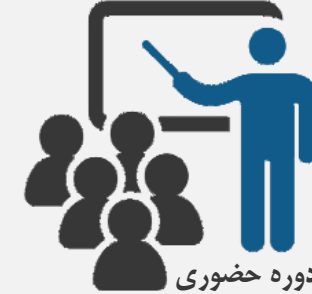
تعداد کل: ۸۳ دوره حضوری